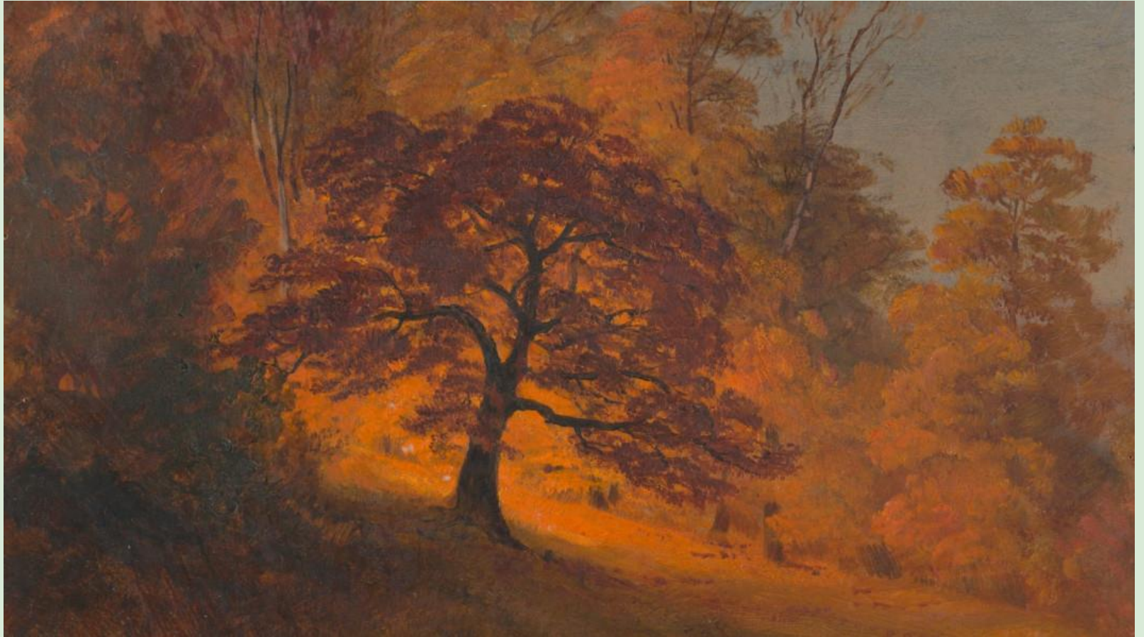
Frederic Edwin Church Feuillage d'automne, 1867. Huile sur carton.

Que voyez-vous? Utilisez le langage plastique.