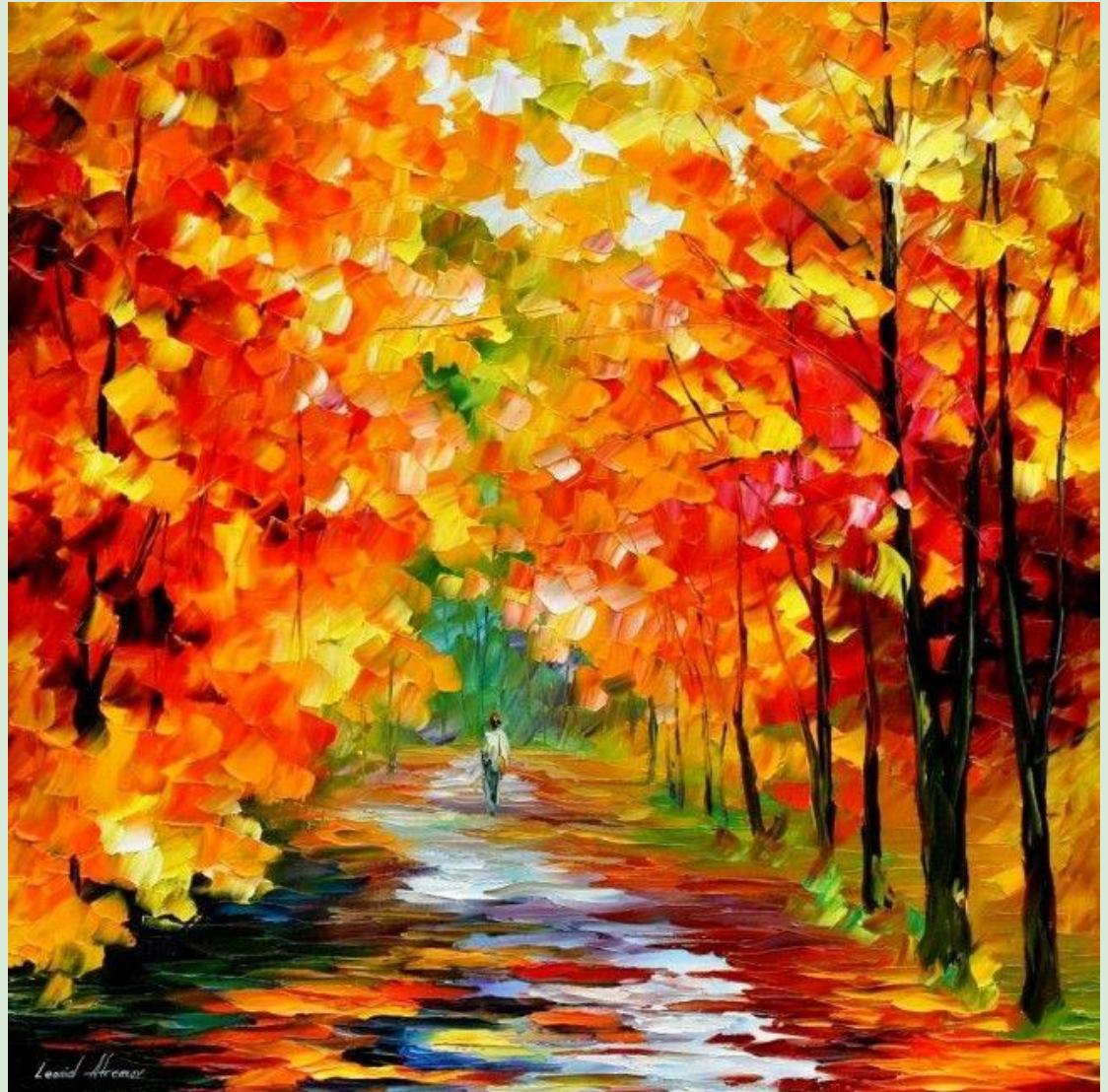
Leonid Afremov Automne Peinture