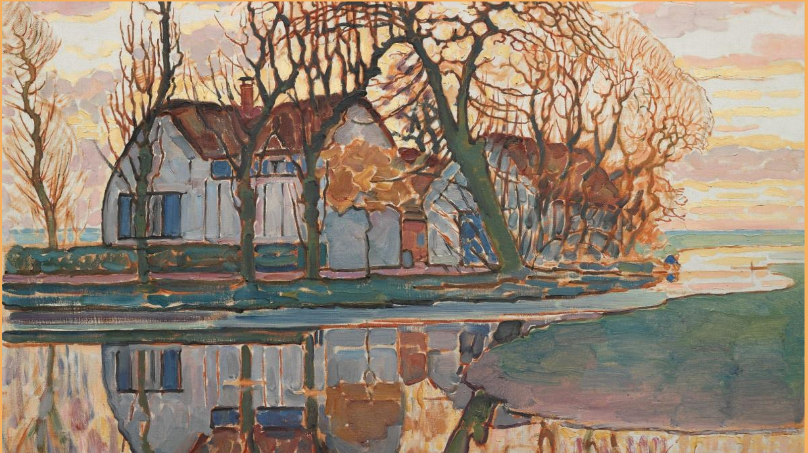
Piet Mondrian Ferme près de Duivendrecht, 1916 Huile sur toile